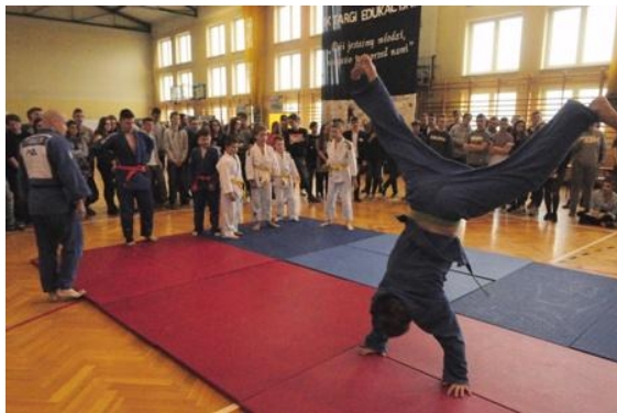
Uczniowski Klub Sportowy Judo Olimp